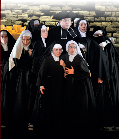
Dialogues des Carmélites

AVEC LE SOUTIEN DE LA DRAC ÎLE-DE-FRANCE